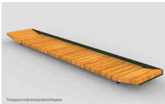
Prototype par le studio de design industriel Deepwater

L'entreprise ITS Wood a été accompagnée dans le cadre de l'activité "I Wood Create" visant à mettre en relation des entreprises de la filière bois et des designers professionnels afin de soutenir le développement de nouveaux produits à base de bois d'origine locale . En collaboration avec le studio de design industriel Deepwater, un prototype de réceptacle de balles de golf en bois local a été conçu.