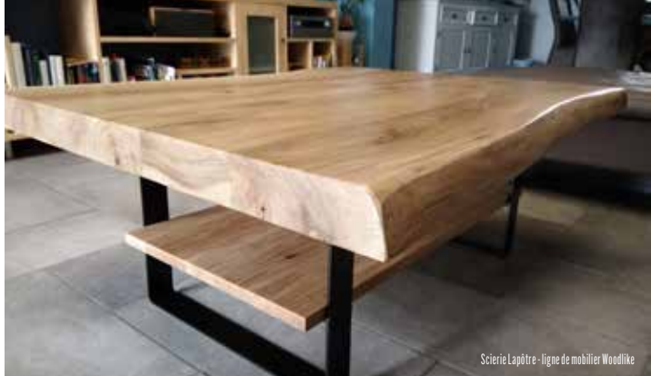
Scierie Lapôte - ligne de mobilier Woodlike

Cette scierie, acquise en 2015 par le groupe Mobic actif depuis 20 ans dans la production et l'installation de maisons à ossature bois, est spécialisée dans le sciage de feuillus. Nous avons réalisé une enquête consommateurs pour le développement de leur CLT de hêtre Cloisobois® . Les panneaux sont autoportants et s'emboîtent facilement pour réaliser des cloisons intérieures.