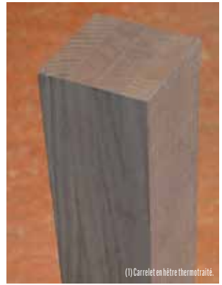
(1) Carrelet en hêtre thermotraité.

Plus d'infos : Tous les résultats de ces recherches sont disponibles sur www.profilwood.eu .