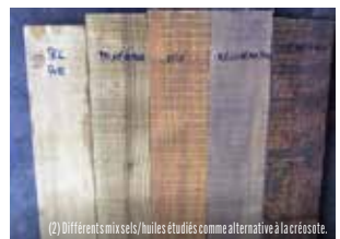
(2) Différents mélanges sels/huiles étudiés comme alternative à la créosote.