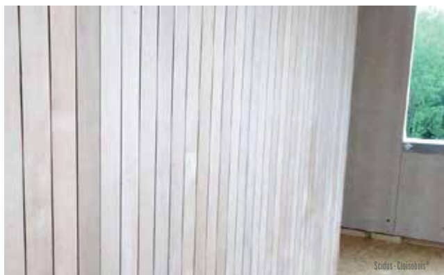
Scidus - Cloisobois®