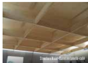
Structure Wood - Dalles en lamellé-collé

Fabricant de poutres en lamellé-collé, Structure Wood a développé un système de dalles en lamellé-collé qui permet d'ajouter facilement un étage ou des pièces supplémentaires à des bâtiments existants. L'accompagnement a consisté en la réalisation de plaquettes de communication éditées en FR et NL pour faire connaître ce nouveau produit.